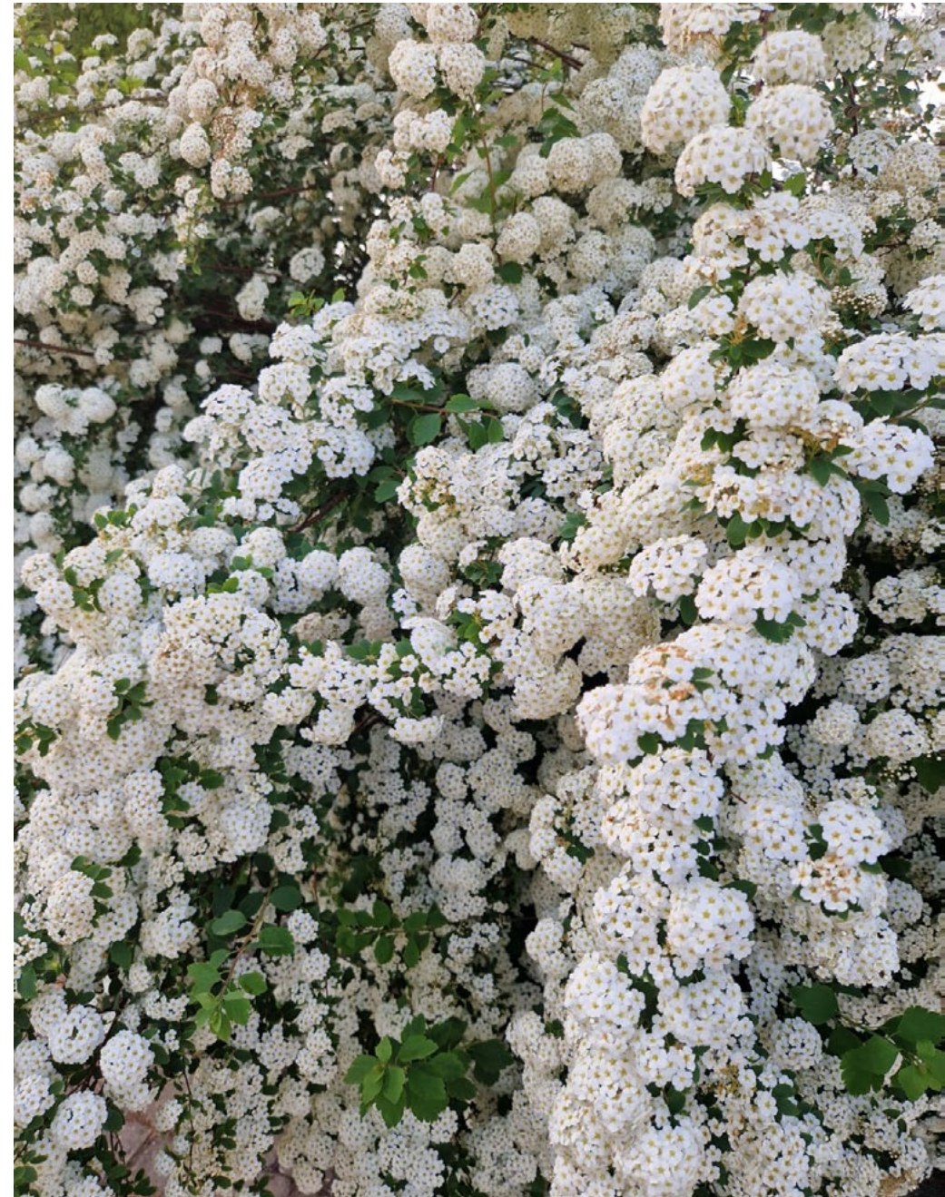
© Text & Bild: Andreas Wilke, Pfarrer

Viele Gnade-um-Gnade-Augenblicke und stets Gnade-um-Gnade-Gewissheit wünscht Andreas Wilke