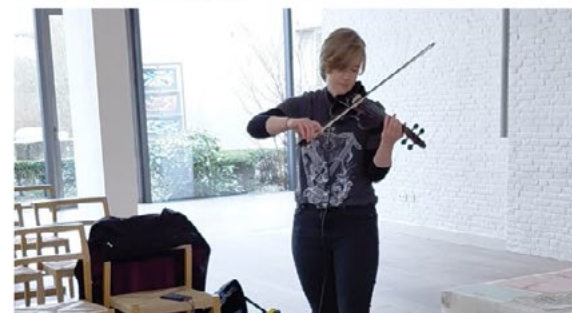
© Text & Bild: Theresa Dreier, Gemeindereferentin